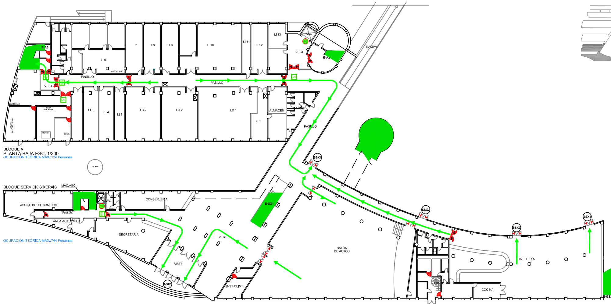
BLOQUE A PLANTA BAJA ESC. 1/300 OCUPACIÓN TEÓRICA MÁX.:124 Personas