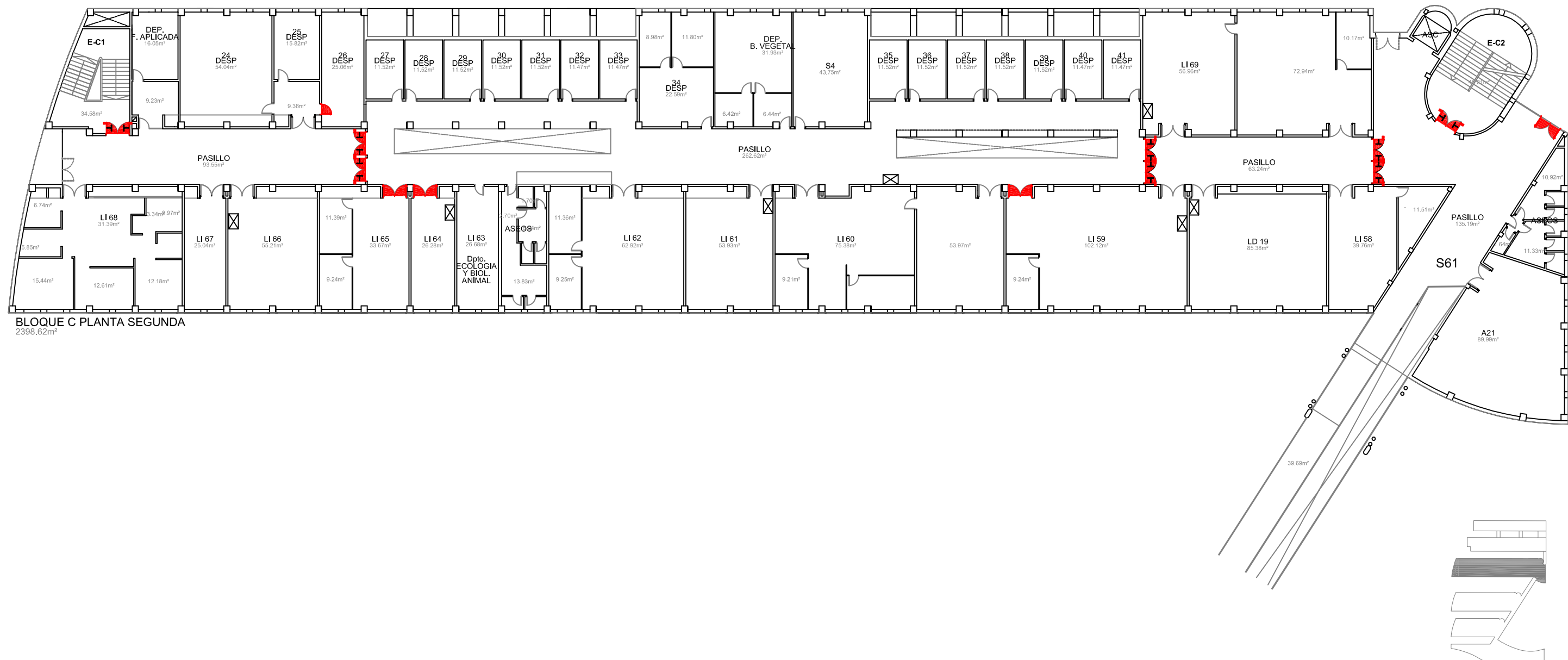
BLOQUE C PLANTA SEGUNDA 2398.62m 2