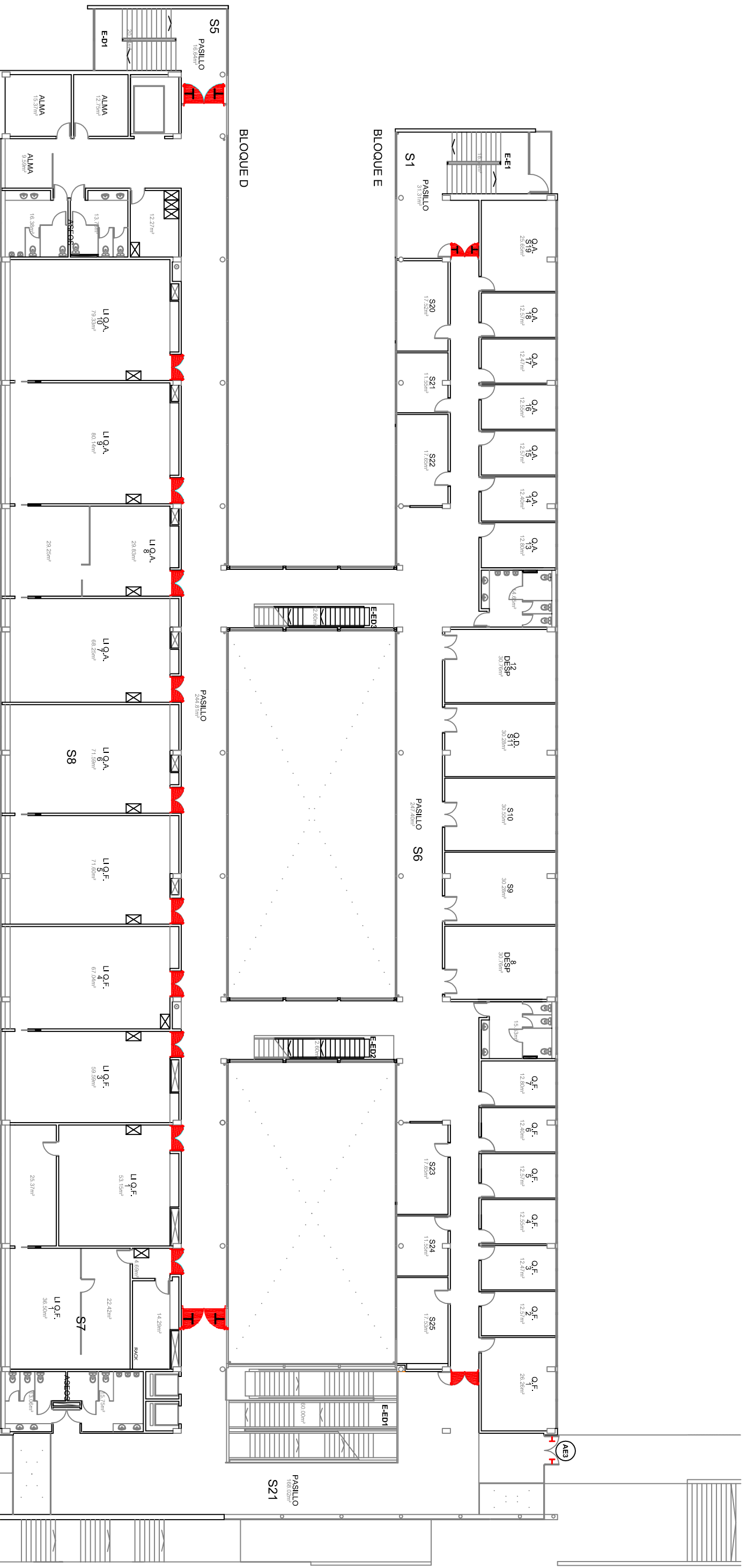
PLANTA SEGUNDA BLOQUES D Y E 2218,43m 2